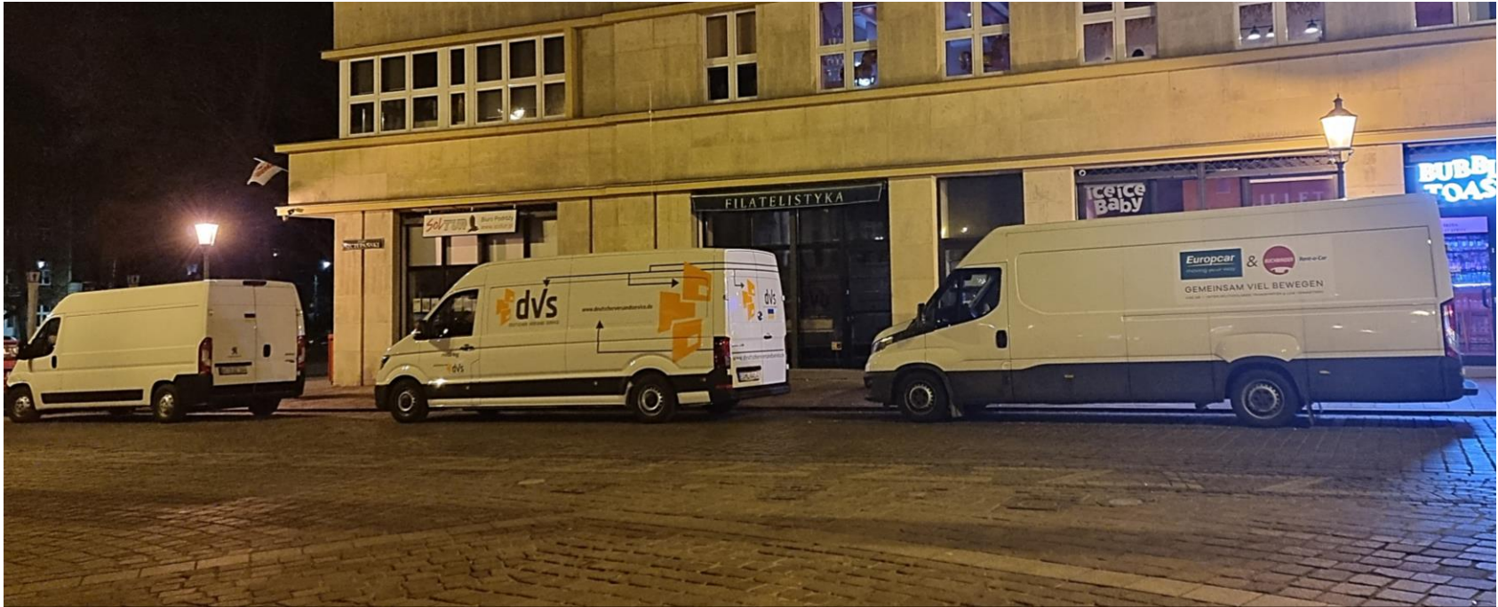
Zwischenstopp in Krakau